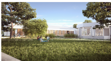
HÉBERGEMENT & ROTONDE